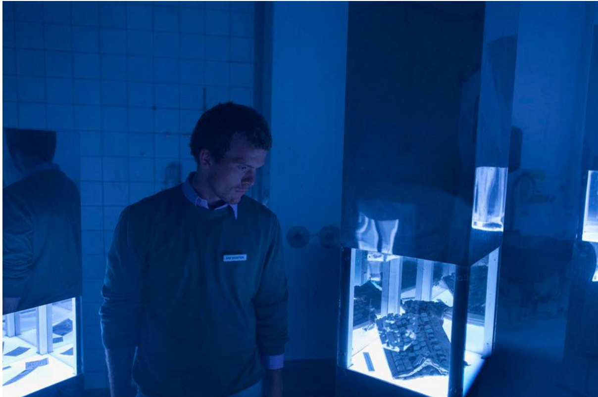
Fra forestillingen Martyrmuseum (2016).